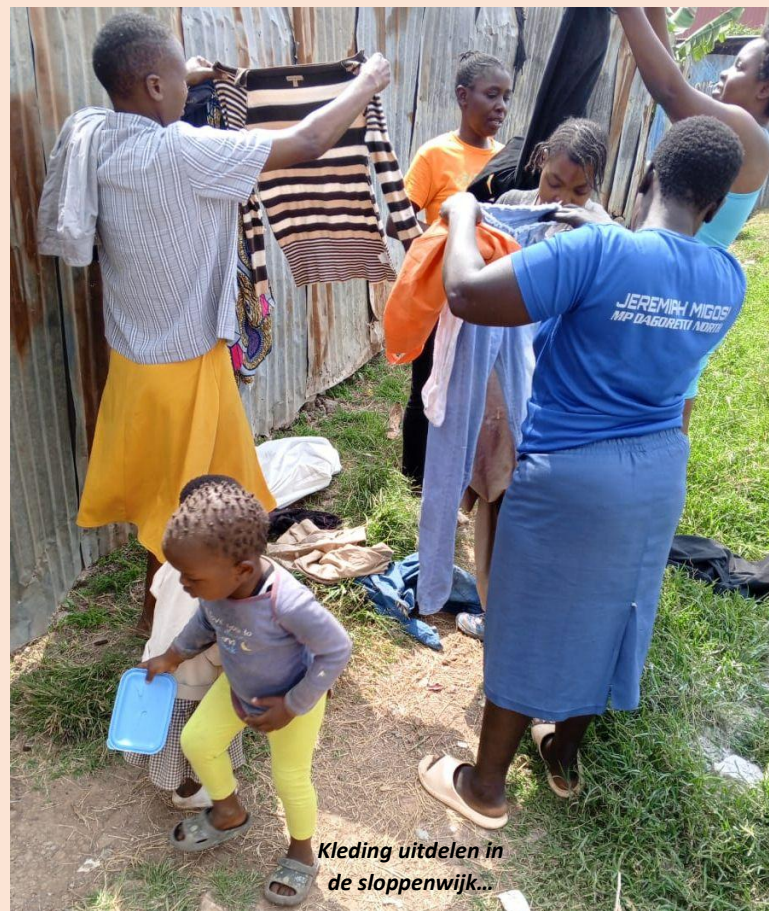
Kleding uitdelen in de sloppenwijk...