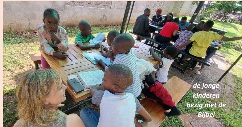
de jonge kinderen bezig met de Bijbel

wordt besteed aan armoede, wat weer leidt tot prostitutie . Wat kan een vrouw in Afrika nog anders doen om te overleven? En verslavingen? Toch ook vaak een gevolg van armoedig leven, van misbruik door mensen die macht uitoefenen over mensen. Homofilie? Dat juist de traditionele kerkelijke systemen deze mensen uitsluiten waar God ze zonder meer insluit . We leren ze dat het bij Christus altijd in de eerste plaats gaat om trouw en dat geldt ook voor iedereen. En verder? Dat Christus leert dat